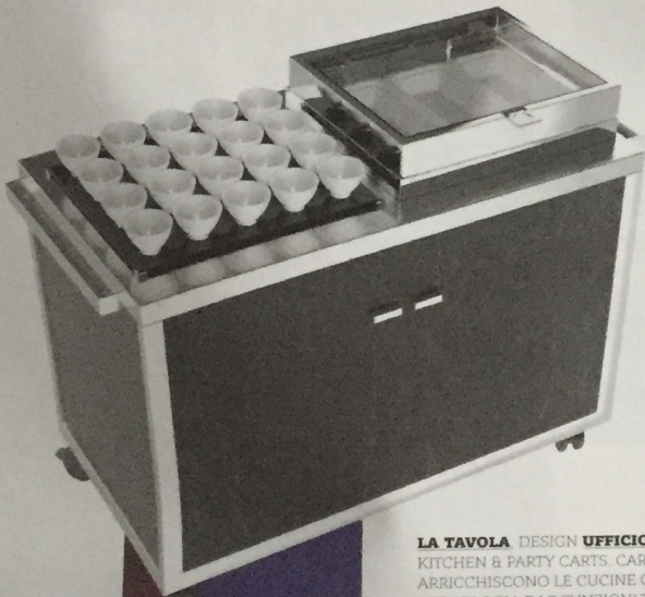
LA TAVOLA DESIGN UFFICIO PROGETTI KITCHEN & PARTY CARTS. CARRELLI CHE ARRICCHISCONO LE CUCINE CON LA TECNOLOGIA E LE FUNZIONI TIPICHE DEI RISTORANTI STELLATI. TROLLEYS THAT ENHANCE KITCHENS WITH THE TECHNOLOGY AND FUNCTIONS TYPICAL OF AWARD-WINNING RESTAURANTS. la-tavola.it