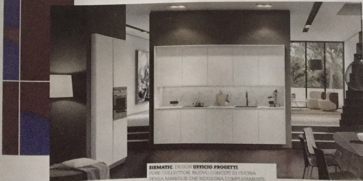
SIEMATIC DESIGN UFFICIO PROGETTI PURE COLLECTION. NUOVO CONCEPT DI CUCINA SENZA MANIGLIE CHE RIDISEGNA COMPLETAMENTE LE DIVERSE FUNZIONI. GRIP, LUCE, LINEE, MATERIALI, TRASPARENZA E SPAZIO. PURE COLLECTION, A NEW KITCHEN CONCEPT WITHOUT HANDLES TO COMPLETELY REDESIGN THE VARIOUS FUNCTIONS. GRIP, LIGHT, LINES, MATERIALS, TRANSPARENCY, SPACE. siematic.com