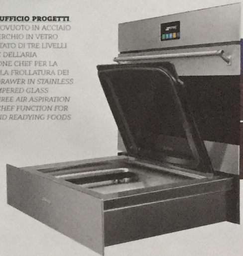
SMEG DESIGN UFFICIO PROGETTI CASSETTO SOTTOVUOTO IN ACCIAIO INOX CON COPERCHIO IN VETRO TEMPERATO DOTATO DI TRE LIVELLI DI ASPIRAZIONE DELL'ARIA E DELLA FUNZIONE CHEF PER LA MARINATURA E LA FROLLATURA DEI CIBI. VACUUM DRAWER IN STAINLESS STEEL WITH TEMPERED GLASS COVER, WITH THREE AIR ASPIRATION LEVELS AND A CHEF FUNCTION FOR MARINATING AND READYING FOODS. smeg.it